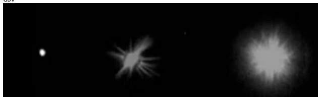
destilliertes Wasser natürliche Wasserstruktur Wasserstruktur Agua Estructurada

Strukturiertes Wasser ist in einem dynamischen Zustand und bindet die Wasser Moleküle zum Informations Austausch. Diese Art von Wasser hat erhebliche Vorteile fuer Menschen, Tiere und Pflanzen und ist im natürlichen Gleichgewicht mit der Natur. Bei regelmaessiger Einnahme von strukturiertem Wasser werden Sie im Laufe der zeit Ihre Gesundheit wesentlich verbessern. Das Wasseraufbereitung System Agua Estructurada ist eine hervorragende Technologie um das Trinkwassser zu vitalisieren. Selbst gutes frisches Quellwasser kann mit dieser Technologie verbessert werden da das Wasser mit Sauerstoff angereichert wird und eine dementsprechend bessere Bioverfuegbarkeit erhält. Durch die Verwendung von Agua Estructurada koennen Sie aktiv dazu beitragen, dass wir eine saubere Umwelt haben.